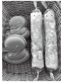
左：大蛇焼き 右：大蛇クレープ