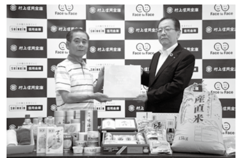
フードバンクむらかみ様へ

支援家庭の増加が見込まれることから、当金庫では今後も継続的に寄付を実施し、課題解決に取り組んでまいります。