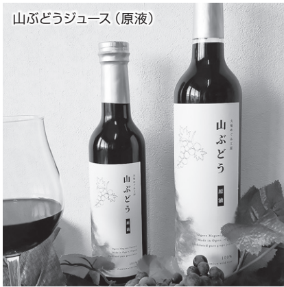
山ぶどうジュース（原液）

父が兼業で農業をしていましたが14年前に仕事を退職 したのをきっかけに減反した田んぼで山ぶどうなどの 栽培を始めました。“どうせなら商品化してみよう”と大 毎めぐみ工房を共同で立ち上げスタートさせました。 お近くで見かけた際にお手にとって頂けたら幸いです。