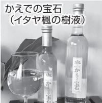
かえでの宝石 （イタヤ楓の樹液）