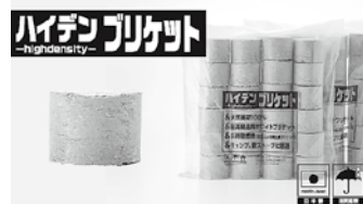
▲薪ストーブ燃料 ハイデンブリケット